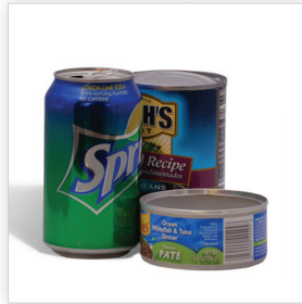
Latas de Aluminio y de Acero vaciar y enjuagar