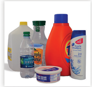
Cocina, Lavandería, Baño: Envases y Contenedores vaciar y tapar