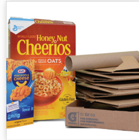
Papel Mixto, Periódicos, Revistas, y Carton Aplanado