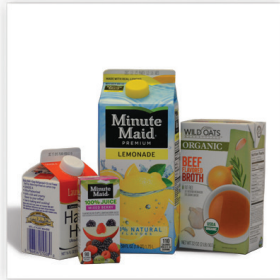
Cartones de Comida y Bebida vaciar y tapar